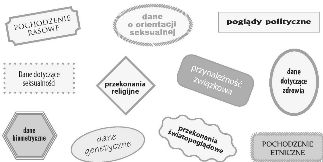
Rysunek 25. Dane osobowe należące do szczególnych kategorii