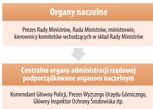
Rysunek 17. Struktura organów centralnych

W doktrynie, czyli nauce prawa administracyjnego, organy centralne dzielimy na organy naczelne oraz tzw. urzędy centralne , czyli centralne organy administracji rządowej, które są podporządkowane organom naczelnym – zostało to przedstawione na rysunku 17.