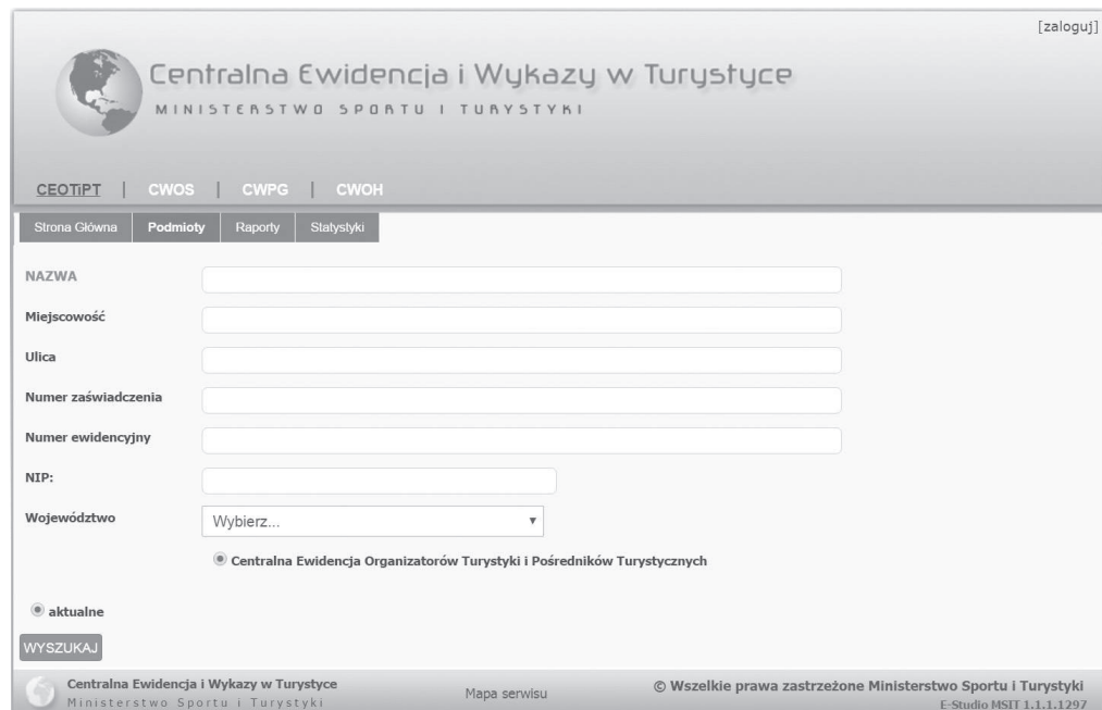
Rysunek 5. Wyszukiwarka podmiotów wpisanych do CEOTIPT